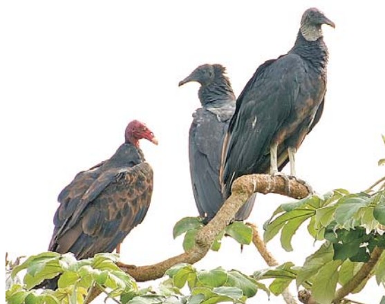
Fig. 2. Zopilotes ( Coragyps atratus ) juvenil y adulto, perchando junto a un Aura Tiñosa ( Cathartes aura ) sobre una Yagruma ( Cecropia peltata ), en la Sierra de Bibanasi, provincia de Matanzas, Cuba.

auras; y al sur del puente de Bacunayagua, provincia de Matanzas. Garrido y Kirkonnell (2000) refieren para esta especie, diez registros de avistamiento en los años 1928, 1940, 1960, 1962, 1967, 1970, 1979, 1995 y 11 de julio de 1996, en la región central y occidental de la isla, avistamientos estos que