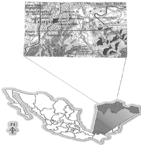
Fig. 1. Localización del cacaotal estudiado en el Cerro El Madrigal, San José Puyacatengo, Municipio de Teapa, Tabasco, México.

enclavado en la selva que forma parte del Cerro El Madrigal, Municipio de Teapa, Tabasco, México (Fig. 1). Dicho cacaotal está situado en la ladera que se encuentra en San José Puyacatengo en los terrenos cercanos al Centro Regional Universitario del Sureste (CRUSE), de la Universidad Autónoma de Chapingo; el área seleccionada comprende una extensión de 200 m de largo por 100 m de ancho. La sombra del cacao la conforman elementos arbóreos de selva con alturas de 15 a 20 m, el estrato medio formado por los árboles de cacao, un estrato herbáceo de plántulas de aráceas y el suelo con gran cantidad de hojarasca.